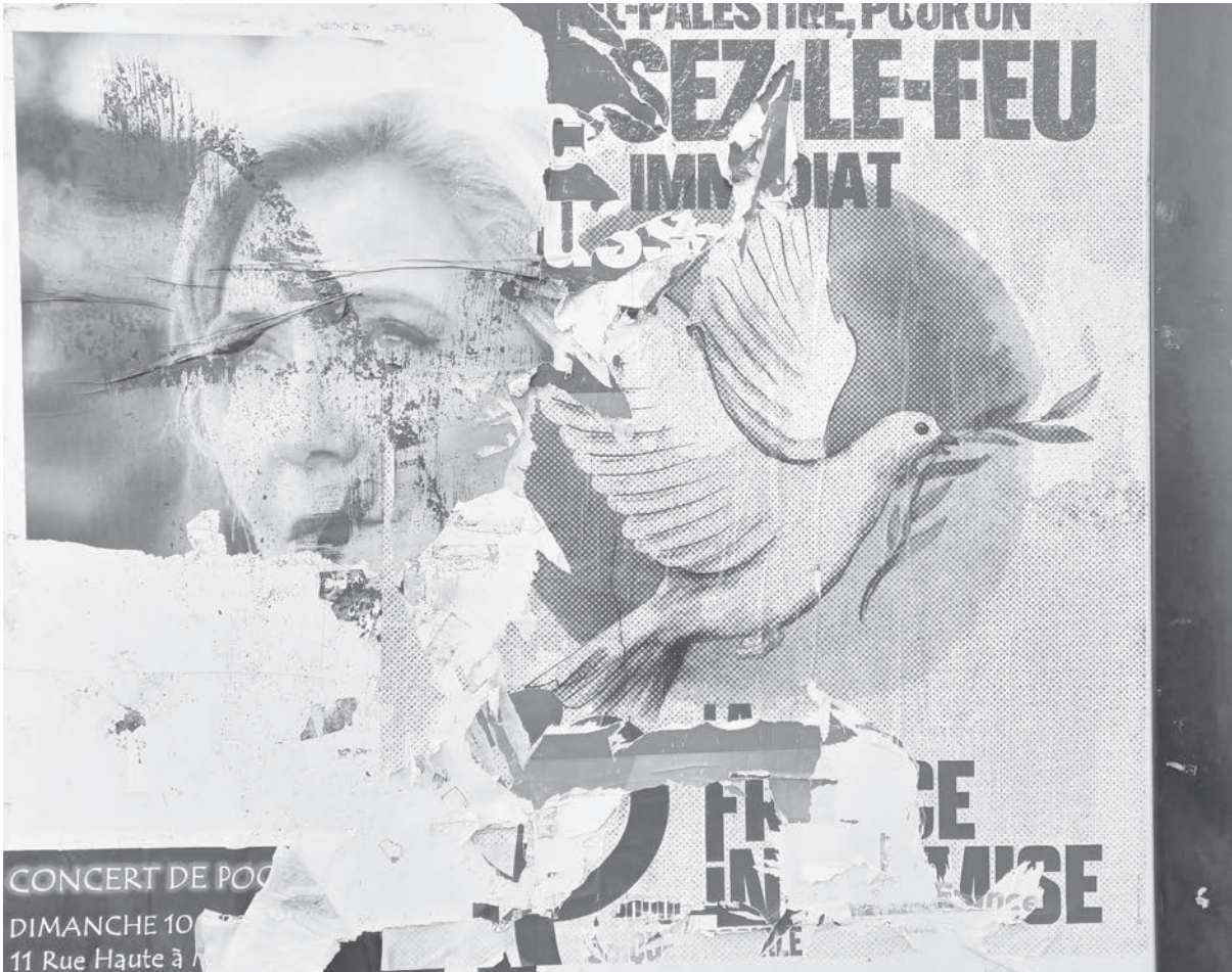
Zerissene Hoffnung auf einen Waffenstillstand?

Zeitung des Europäischen BürgerInnenforums