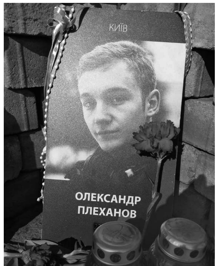
Erschossen von einer Spezialeinheit der Polizei im Februar 2014 wie 100 andere Aufständische auf dem Maidan-Platz in Kiew.

Hier, völlig chaotisch, noch verschiedene Fakten und subjektive Eindrücke: Die Familienmitglieder einiger Soldaten protestieren öffentlich und fordern ihre Demobilisierung nach bald zwei Jahren an der Front. Das