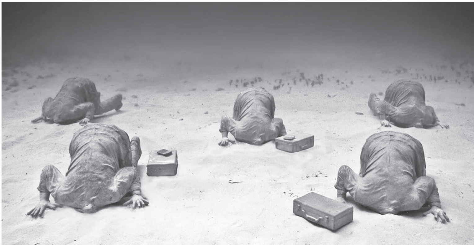
Unterwasserskulpturen, Jason Decaires Taylor