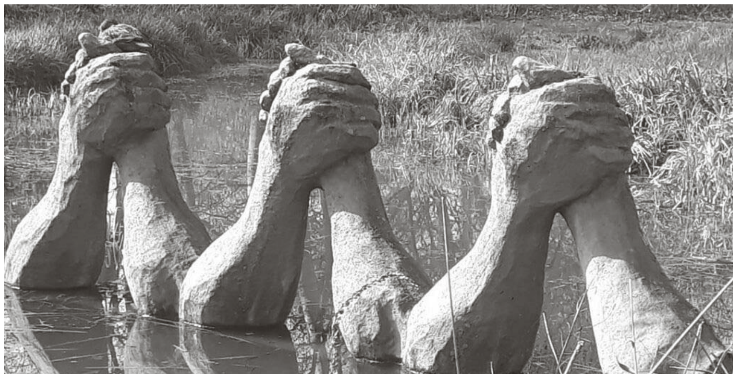
Kasia Ozga, Bras de fer, polystyrène et résine, 2011-12.

Les statistiques officielles disent 350.000. Certaines estimations sont bien plus élevées,